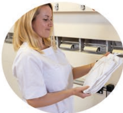
Clasificación por residente