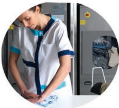
Programas de lavado específicos